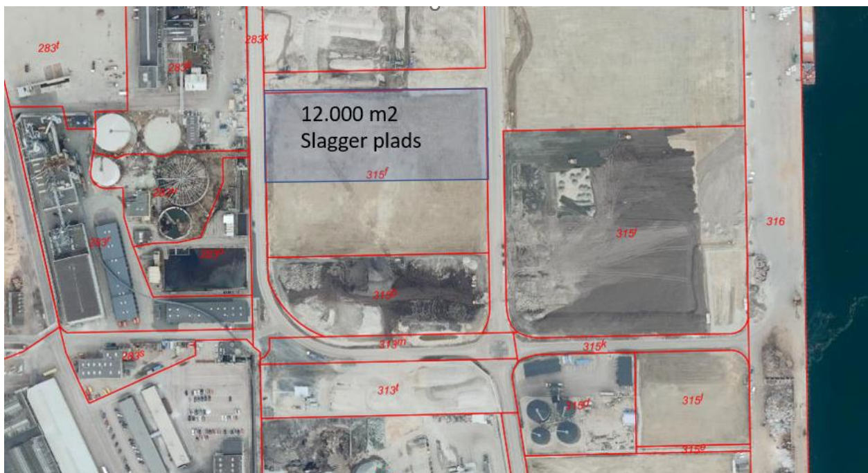
Figur 1: Placering af miljøplads

Arealet er en del af matrikelnummer 315f, Køge Bygrunde og er et areal som udlejes af Køge havn.